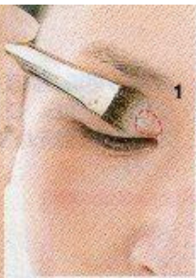
目頭から黒目の内側(1の 位置)にまで、パール感の ある白やゴールドをのせる。

「まぶたがたるむと、アイラインが 引きにくくなり、にじみやす くなりやす。そうなったら、線よ りも面で立体感を出すアイメイ クにシフトを。左右差が気になる ら、たるんでいる方の目尻に濃い 色を広めに入れて」(杉村さん)