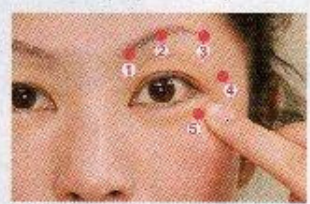
写真の5か所のツボを①から順に3秒ず つプッシュ。たるみだけでなく、かすみ 目や充血など目のトラブルに効果がある。

「長時間パソコンを 使うことでドライア イになる人が増えて います。そうすると 目元の血流がとど おり、老廃物がたま ってたるむんですよ。 疲れをためないよう、 毎日ツボ押しを二天 野木さん」