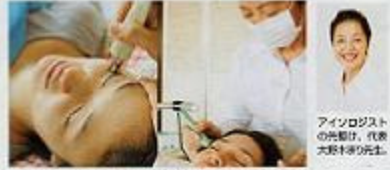
高圧気流とほのか効果で目元の緊張をゆるみ解きほぐす。 高濃度保湿を塗るしながら、高圧気流で目のツボを刺激。