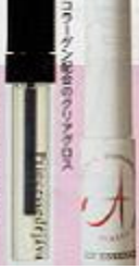
唇腫れリムーバーキープ