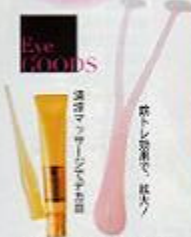
(左)アイバランサー ¥980/AK4624 (右)フェイス スマートメソッド フラッシュアイズ 30g ¥4000/美空堂