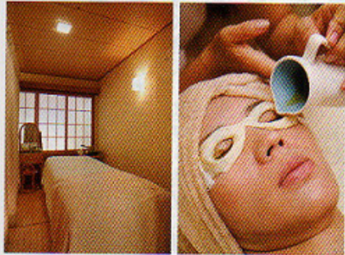
左・隠れ家のような落ち着いた一軒家サロン。 右・目の中に、無塩バターオイルを流し入れる。

目の疲れを取り、美しい目にするという噂の目のエステ「ネトラバステイ」(30分3,150円)を行っているサロン。これは、インドの伝統的な予防医療、アーユルヴェーダの眼精疲労回復メニューだ。小麦粉を水で練ったもので、眼の周りに「土手」を作り、その中に38〜42度の精製した無塩バターオイルを流し込むというもの。無塩バターにはオプシオンでヒアルロン酸やビタミンBを配合することもでき、目に栄養を与えると同時に、汚れを取り除き、白目をキレイにしてくれる。目や耳、頭のマッサージもしてくれるので、終了すると、視界がクリアに、広がったような感覚だ。