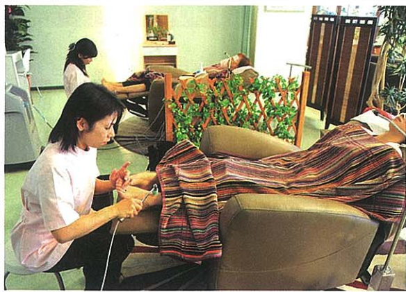
アイソジスト器で、全身の経絡(ツボが並ぶ道筋)を刺激する。それによりエネルギーや血液の流れがスムーズに。むくみや生理痛にも効果大。