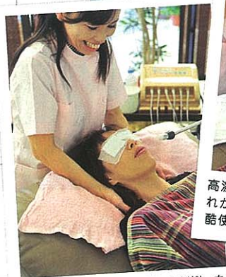
肩甲骨の間を下から押して刺激。血行がよくなり肩凝りに効果抜群!思わず「あ〜気持ちイイ!」。